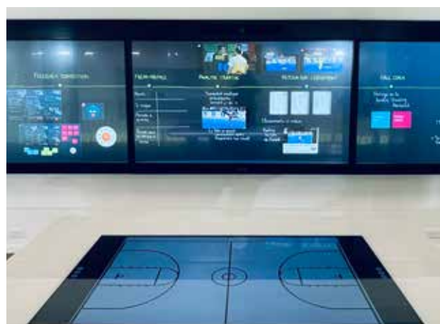
Salle de collaboration